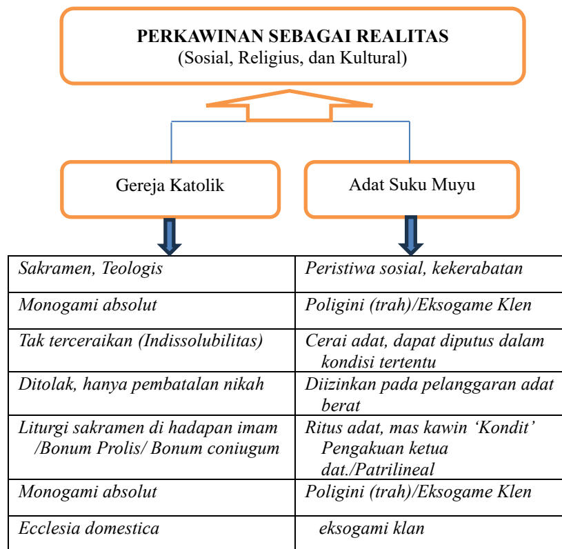
Gambar 1. Kerangka Konseptual

Gereja mendasarkan perkawinan pada kehendak ilahi di satu sisi dan di sisi lain memiliki dimensi sakramental (tanda yang menghadirkan kasih Allah), sedangkan adat Muyu memaknainya dalam konteks sosial dan sebagai moment dalam menjaga keseimbangan relasi antar-keluarga. Dalam Gereja Katolik, perkawinan bersifat tak terceraikan secara mutlak. Dalam adat Muyu, perkawinan dapat diputuskan bila terjadi pelanggaran terhadap norma-norma perkawinan, meskipun ikatan sosial tetap dihormati.